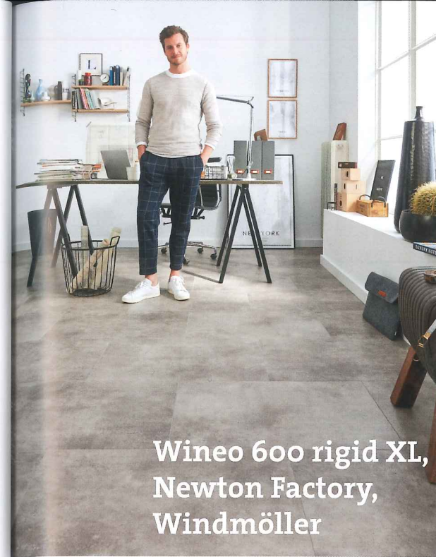
Wineo 600 rigid XL, Newton Factory, Windmüller

Gerflor ist ein von Raumausstattern und Fachhändlern in Deutschland geschätzter LVT-Lieferant. Niemand im