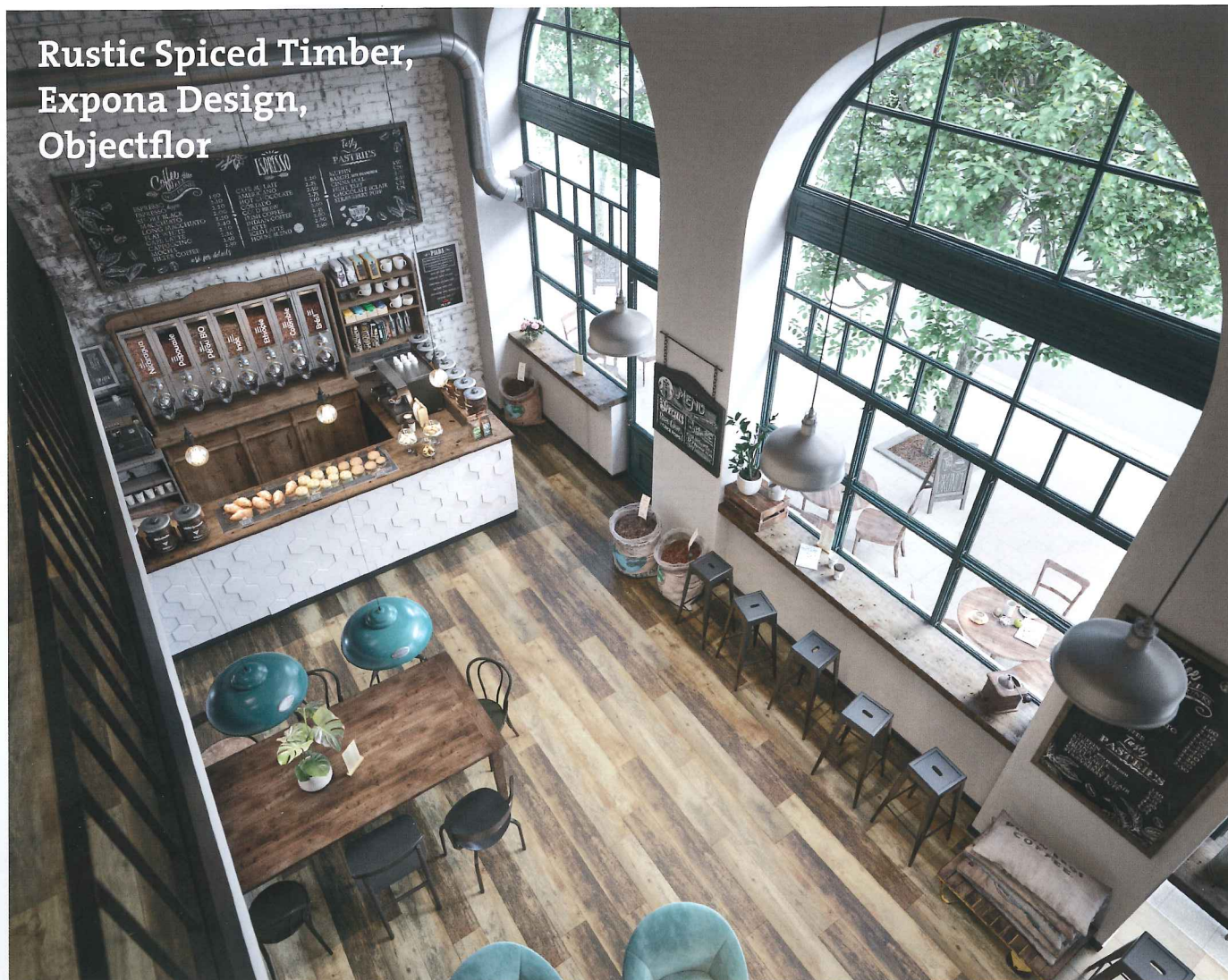
Rustic Spiced Timber, Expona Design, Objectflor