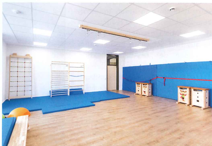
Die Kinder können auf »Purline«-Bioboden rennen und toben, ohne nennenswerte Spuren zu hinterlassen. Auch mit Blick auf Geh- und Trittschallwerte schneidet der Bodenbelag gut ab.