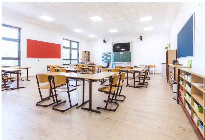
Mit seinen hellen Holzdekoren schafft der »Purline«-Bioboden ein freundliches Ambiente in den Klassenzimmern sowie in Verwaltung, Fluren und Aula.