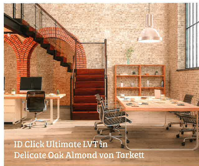
ID Click Ultimate LVT in Delicate Oak Almond von Tarkett

In den Einzelbewertungen liegt Forbo im Mittelfeld, steht nie ganz oben und nie ganz unten. Dritte Plätze und jeweils eine Eins vor dem Komma gab's für den Sympathiewert (1,81) und die Produktqualität (1,95). Letztes Mal noch gutes Schlusslicht bei der Vertriebspolitik (Note 2,28), stehen die Paderborner hier diesmal mit einer 2,06 auf Platz vier. Die Nachhaltigkeitsnote liegt mit 2,58 mittendrin, vielleicht aber bald schon weiter oben? Was der Bodenbelagsanbieter hier