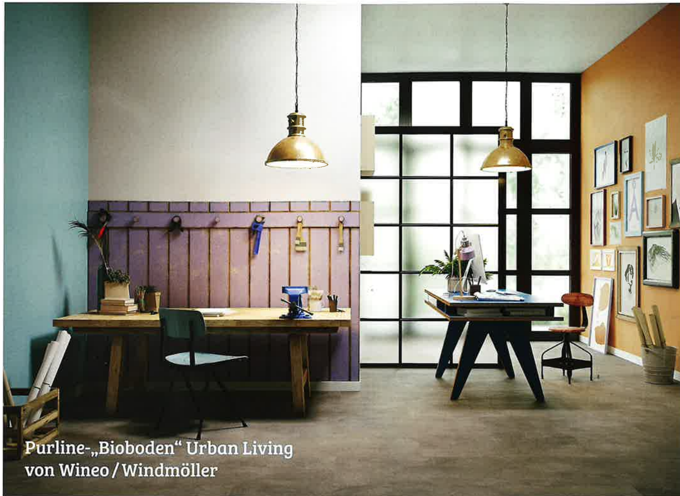
Purline-„Bioboden“ Urban Living von Wineo / Windmüller