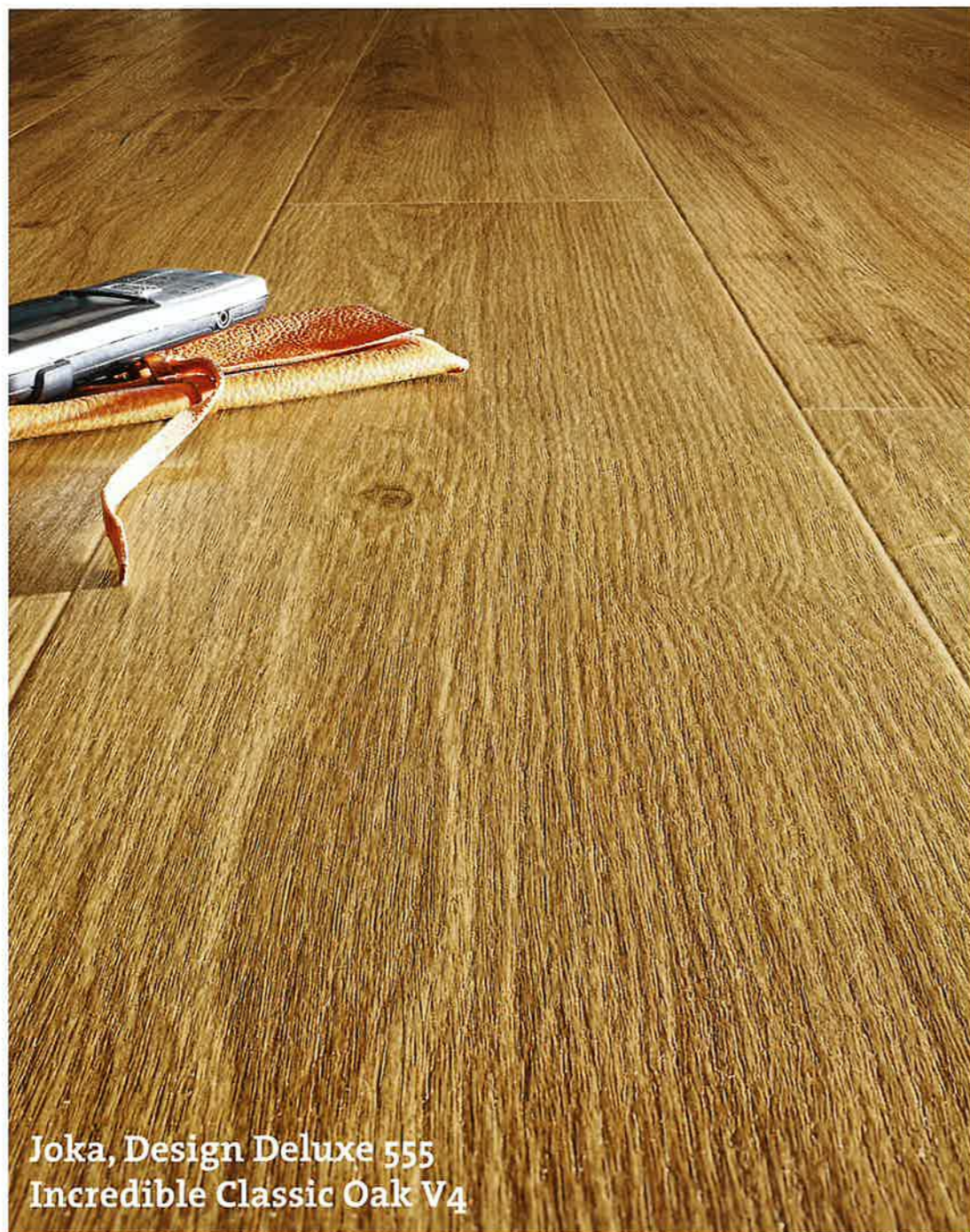
Joka, Design Deluxe 555 Incredible Classic Oak V4

Zukunftsperspektiven -, wird kein Unternehmen besser bewertet als Jab Anstoetz - nur Jordan ist hier auf Augenhöhe.