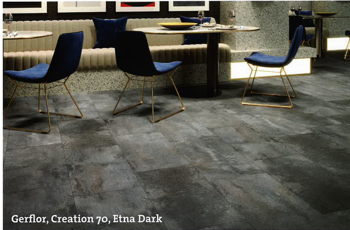
Gerflor, Creation 70, Etna Dark