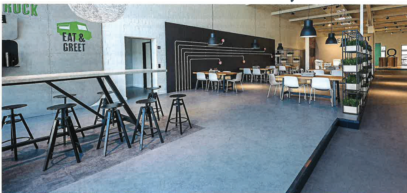
Mit seiner ruhigen Betonoptik sorgt der „Purline Bioboden wineo 1500 fusion pure.three“ für eine angenehme Atmosphäre in der Catering-Area im modern gestalteten Wineo-Workspace.

tionsmittel, so der Hersteller. Die Basis des elastischen Polyurethan-Bodens bildet der Hochleistungsverbundwerkstoff „Ecuran“. Dieser wird zu einem überwiegenden Teil aus Pflanzenölen und natürlich vorkommenden, mineralischen Komponenten hergestellt – ohne Zusatz von Chlor, ohne Weichmacher und ohne Lösungsmittel. Neben dem Blauen Engel und TÜV Profi-Cert trägt der „Bioboden“ auch das Cradle-to-Cradle-Zertifikat in Silber. ■